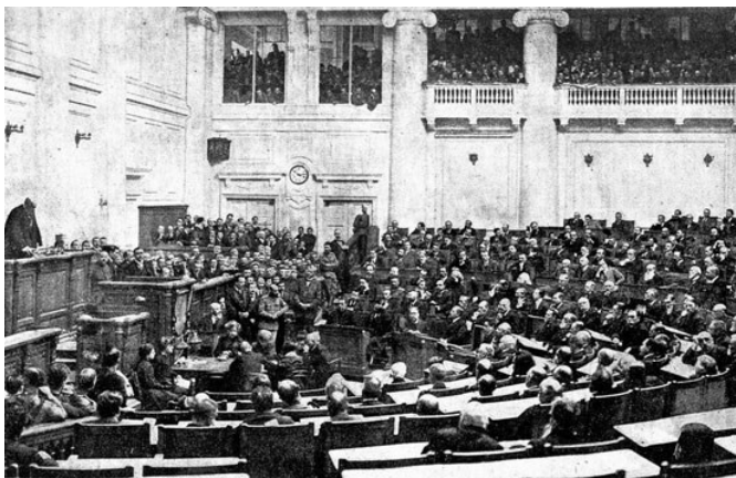
Засідання Першої Державної Думи Росії за участі Української фракції

Підсумовуючи, можна сказати, що діяльність української думської громади мала неабиякий вплив на розвиток національного руху і подальші історичні події в Україні. Адже свою державу можна було б будувати лише за наявності не тільки розумних, а й національно свідомих людей.