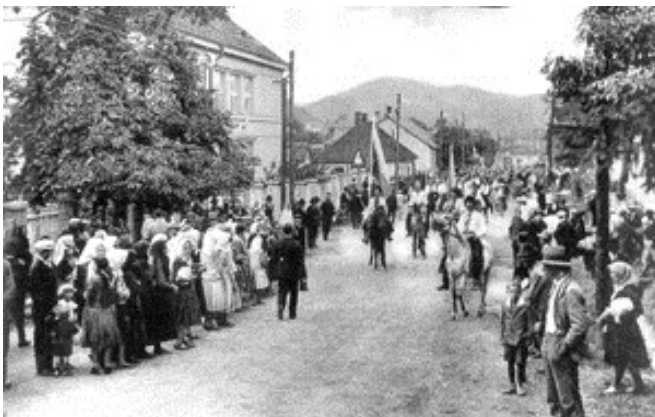
Свято «Просвіти» в м. Перечині Закарпатської області.

Молода Україна – це той перехідний час, коли українська інтелігенція та молодь відходять від культуриництва і політично нейтрального українофільства і починають дошукуватись політичного розв'язання українського питання. Їхня діяльність в умовах царської Росії була вкрай небезпечною, та це не лякало палких молодих людей, які прагнули зняти довговічне ярмо зі свого народу, щоб зробити його вільним. Серед них були Кость Левицький, Володимир Дорошенко Михайло Драгоманов, Володимир Антонович, Сергій Подолінський, Іван Франко, Михайло Коцюбинський та багато інших.